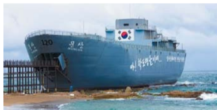
▲ 영덕 호국 전시관 문산호

싸우다 산화한 학도병들을 기리기 위해 위령탑과 전적비가 자리 잡고 있다. 이들을 잊지 않은 사람들이 여전히 그 발걸음을 이어가고 있는 것을 보고 있으면 가슴속이 뭉클해지는 것을 느낄 수 있다.