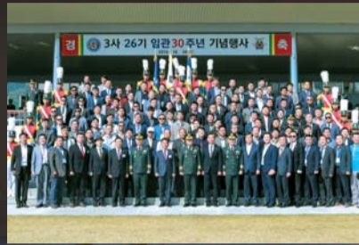
▲ 임관 30주년 기념(3사 26기)