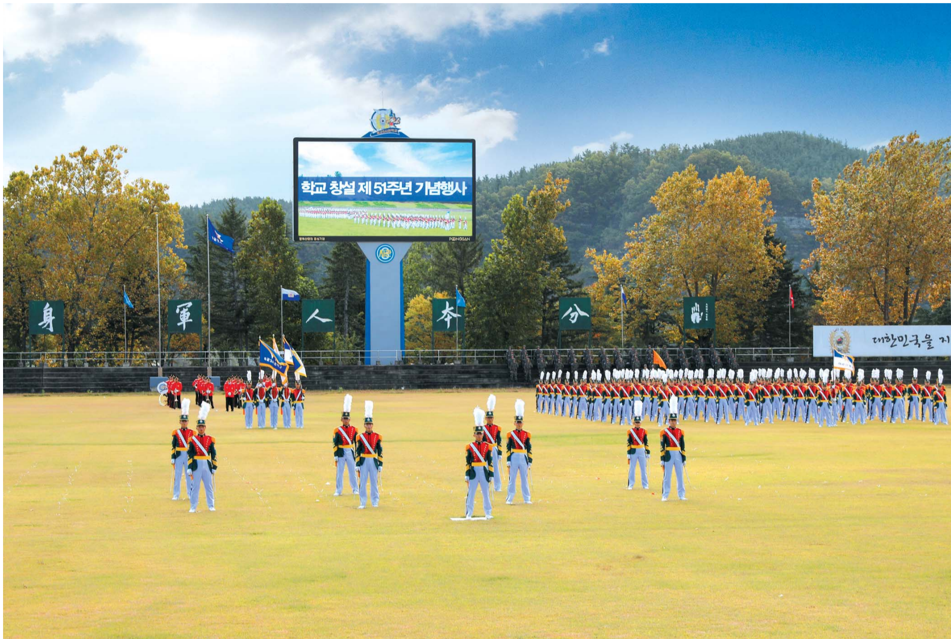
▲ 학교 창설 제51주년을 맞아 기념행사를 진행하고 있다.