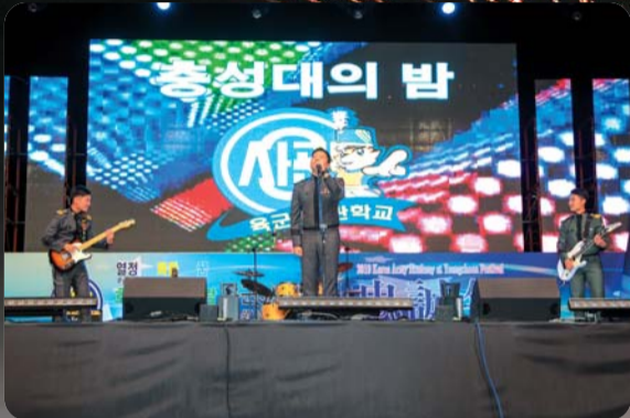
▲ '충성대의 밤'의 열기를 뜨겁게하는 생도 장기지랑