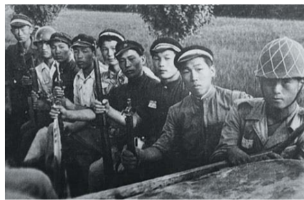
▲ 트럭을타고 전선으로 향하는 학도병들

결국 예정된 작전 종료일보다 5일이 더 지난 9.19일이 되어서야 유엔군은 '조치원호'라는 또 다른 상륙함을 장사로 보내어 상륙부대를 구출작전을 진행하게 된다. 허나 문산호 때와 마찬가지로 적의 거센 공격과 기상악화로 인해 온전한 구출작전을 치르기 어려운 상황이었다. 결국 해변에서 적의 공격에 맞서 싸우던 후위 부대원들의 희생으로 모든 인원을 구출하지 못한 채 해변에서 철수하게 된다. 이후 남아있던 40여 명의 부대원들은 적에게 포로로 붙잡혔으며 100여 명 정도의 인원들이 작전에서 실종 및 전사하였다.