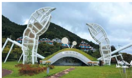
▲ 영덕 대게누리 공원

지친 몸과 마음이 파도에 씻겨 나가는 기분을 느낄 수 있는 해수욕장의 풍경 반대편에는 장사상륙작전의 흔적을 볼 수 있다. 장사상륙작전은 인천상륙작전을 성공시키기 위해 이루어진 작전이다. 그 당시 배가 좌초된 상황에서 북한군과