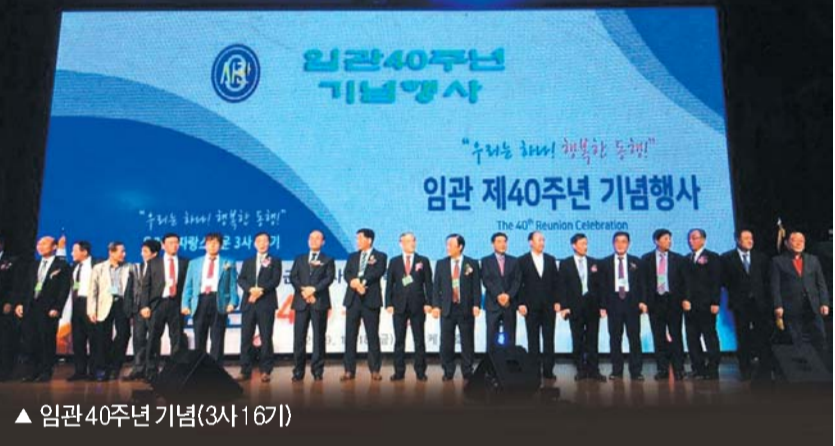
▲ 임관 40주년 기념(3사 16기)