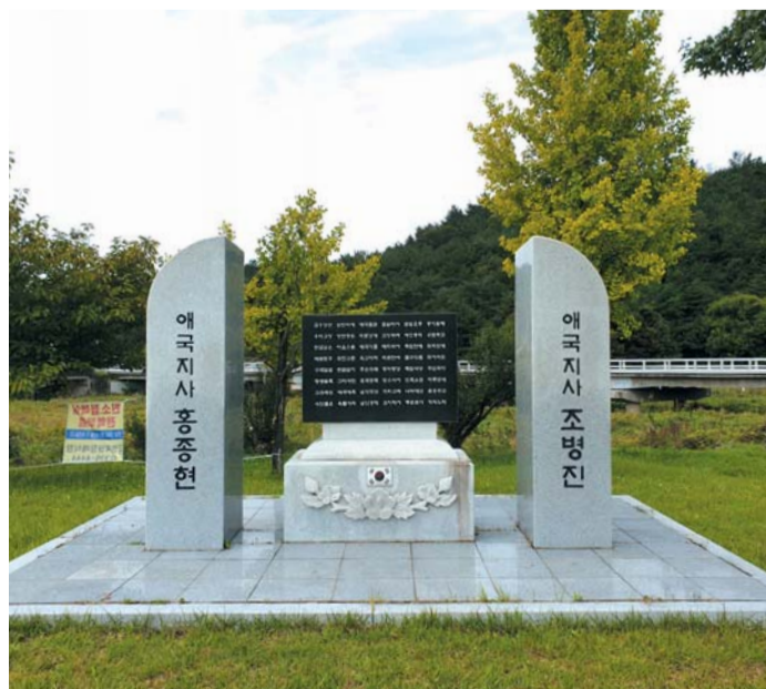
▲ 홍종현·조병진 애국지사 추모비