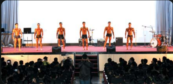
▲ 충성대의 최고 몸짱을 가리는 머슬 3사 선발대회