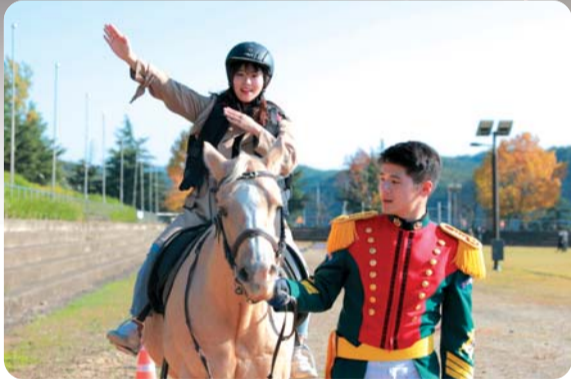
▲ 자인과 함께하는 승마체험