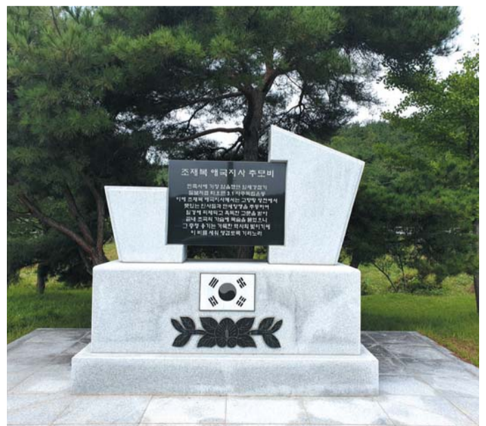
▲ 조재복 선생 애국지사 추모비