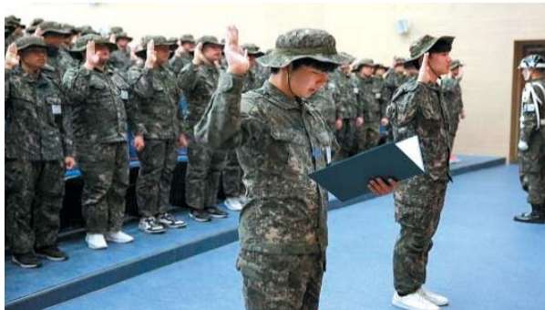
◀ 지난 10월 10일 포항 흥해 공업고등학교 학생들이 충성대 사관캠프 입소식에서 선서문을 낭독하고 있다.