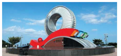
▲ 영덕 삼사해상공원

바다를 향해 뻗어있는 이 길은 동해안의 경치를 즐길 수 있는 충분한 시간을 제공한다. 산책로의 멀지 않은 곳에 삼사해상공원이 있다. 삼사해상공원은 1월 1일 새해맞이 일출 행사와 3월 영덕대게축제 그리고 5월부터 10월까지 주말공원을 진행하고 있어 주말에 가족들이나 친구, 연인과 좋은 시간을 보낼 수 있다.