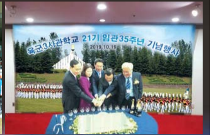
▲ 임관 35주년 기념(3사 21기)