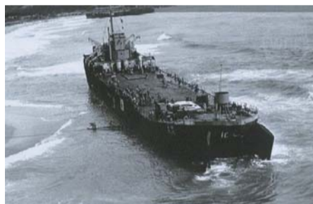
▲ 장사상륙작전 당시 '문산호'

차단할 수 있었다. 또한 인천상륙작전을 위한 양동작전을 성공적으로 수행할 수 있는 전략적 요충지기도 했다. 따라서 작전을 수행하기 위해 육군본부에서는 작전명 174호 즉, 장사 상륙작전을 지시하게 된다. 그러나 부대를 구성하기에는 국군의 역량이 어려운 시기였다. 당시 낙동강 전선을 최후의 교두보로 삼게 되면서 전선의 후퇴로 동원할 수 있는 병력이 제한되었기에 작전부대원 772명 중 677명을 학도병으로 구성하여 작전을 시행하게 되었다. 이들 대부분은 중학생에서 고등학생으로 구성된 학도병으로 훈련기간은 2주에 불과했으며 자원 또한 치열한 전장상황으로 충분한 지원이 어려운 상황이었다. 지급된 전투복과 무기는 모두 노획 물자였으며 수량 또한 부족한 상태였다. 모든 것이 열악한 상태였으나 장사 상륙작전 부대는 9월 13일 오후에 상륙함 '문산호'에 부대원을 싣고 장사리로 출항하게 된다.