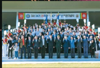
▲ 임관 10주년 기념(3사 44기)