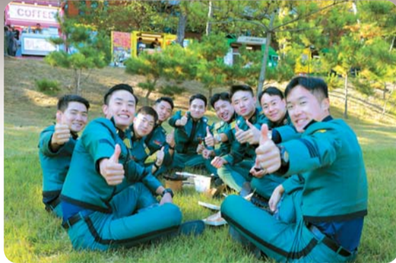
▲ 생도들의 즐거운 오후 한때