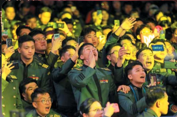
▲ 충성대의 밤을 즐기는 사관생도들