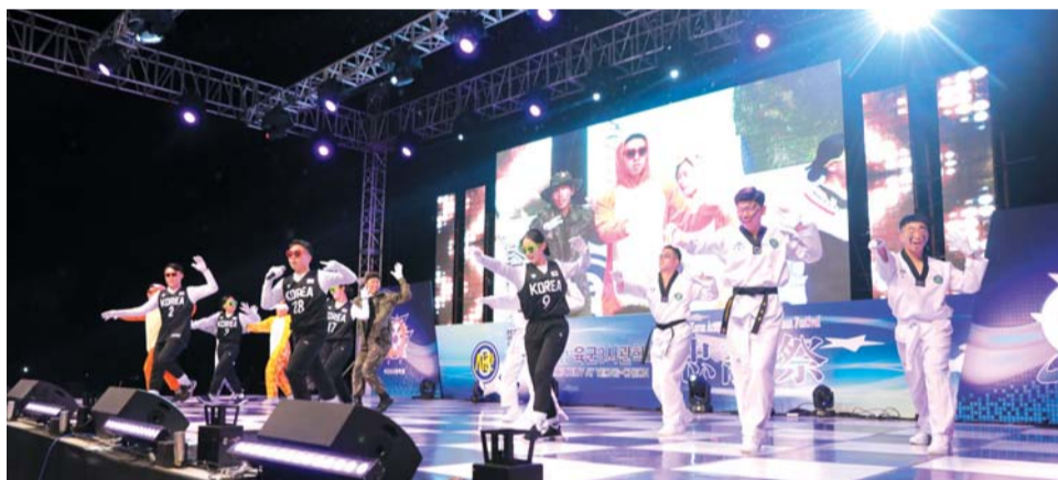
▲ '충성대의 밤'의 열기를 뜨겁게 하는 생도들의 장기자랑이 펼쳐지고 있다.