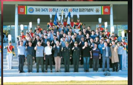
▲ 임관 20주년 기념(3사 34기)