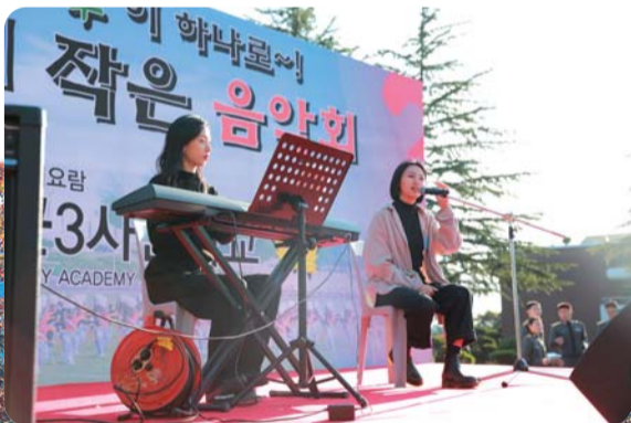
▲ 작은 음악회 공연