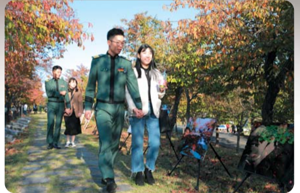
▲ 호국정의 낭만을 즐기는 생도와 연인