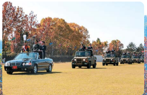
▲ 임관 30주년을 맞이한 3사 26기 열병식