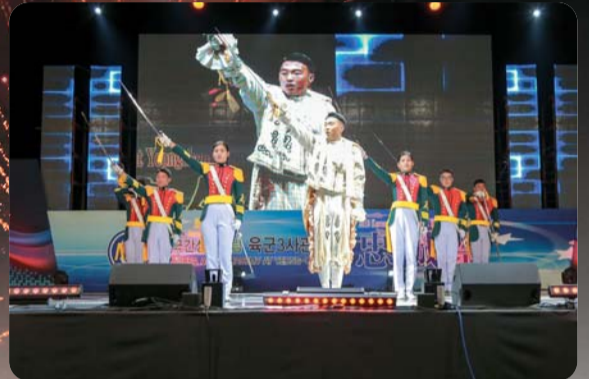
▲ 생도 응원단 '시리우스'의 공연